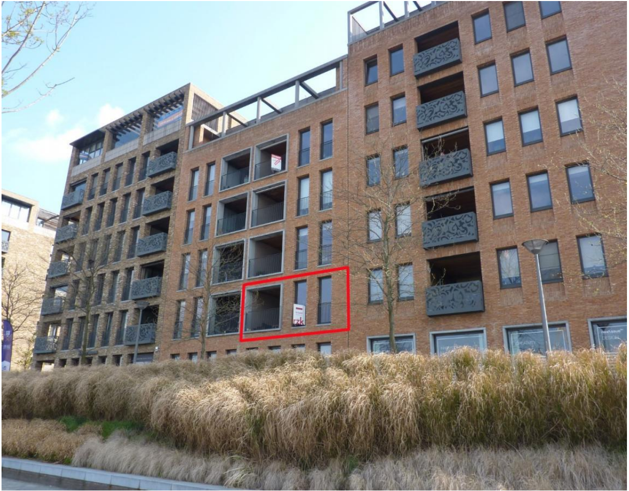
Figuur 2: voorbeeld 'in-pandig terras' (rode kader)